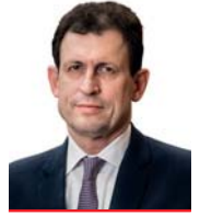
CHRISTOPH GRABENWARTER Der Autor ist Präsident des Verfassungsgerichtshofes.

Was bestimmt den VfGH, eine längere oder kürzere Frist zu setzen? Es sind Fragen der Komplexität einer Neuregelung, des Erfordernisses einer Ersatzregelung, die Schwere des Grundrechtseingriffs auch und vor allem mit Blick auf europäische Grundrechte (zur Vermeidung einer Weitergeltung einer als konventionswidrig erkannten Rechtslage, die zu einer Verurteilung durch den EGMR führen könnte). Für komplexere Materien wie das Verbot des assistierten Suizids oder eben die Sicherstellung von Beweismitteln wurde eine eher längere Frist von einem Jahr ge-