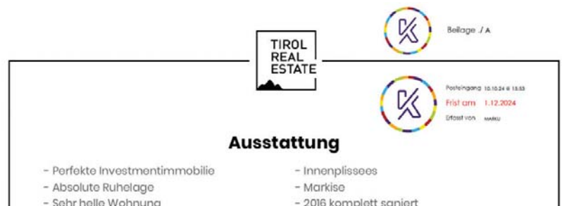
PDF-Dokument mit Beilagen und Fristenstempel

und ermöglicht es, schneller auf relevante Stellen zuzugreifen. Anstatt mit handschriftlichen Notizen zu arbeiten, die leicht übersehen werden können, bleiben alle Hinweise klar und übersichtlich im digitalen Akt vermerkt. Alle getätigten Anmerkungen werden in einer speziellen Übersicht angezeigt und durch Klick auf die jeweilige Anmerkung kommt man sofort zur entsprechenden Stelle im Dokument. Dies spart nicht nur Zeit, sondern erhöht auch die Effizienz bei der Vorbereitung auf Verhandlungen oder Gerichtsprozesse.