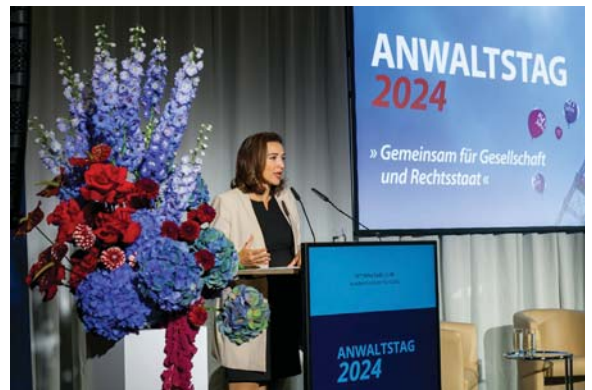
Begrüßung von BM in Alma Zadić

Die Selbstverwaltungskörper sind „Kontinuitätsträger“ über Nationalratswahlen hinaus. BM in Edtstadler würdigte Rechtsanwältinnen und Rechtsanwälte als Vertreter in schwierigen Lebenslagen an vorderster Front. BM in Zadić verwies auf die umgesetzten Projekte des vergangenen Jahres, die Reform des Verteidigungskostensatzes und die Einführung der FlexCo. Für 1. 1. 2025 kündigte sie das Inkrafttreten der Strafrechtsreform an.