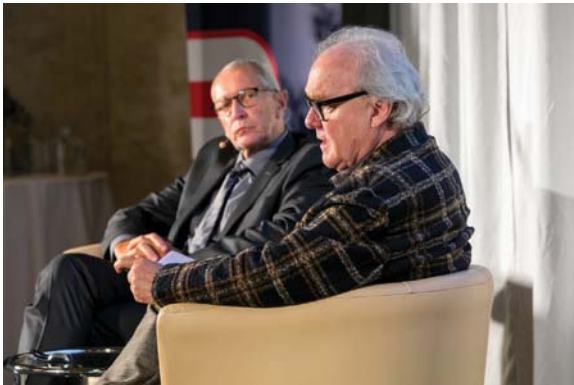
Univ.-Prof. Dr. Konrad Paul Liessmann und Michael Köhlmeier

Den Festvortrag gestalteten diesmal Bestseller-Autor Michael Köhlmeier und Univ.-Prof. Dr. Konrad Paul Liessmann , die anhand einer historischen Reise in die griechische Mythologie einen kontroversen Diskurs über Moral und Recht hielten.