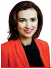
ALMA ZADIĆ Die Autorin ist Bundesministerin für Justiz.