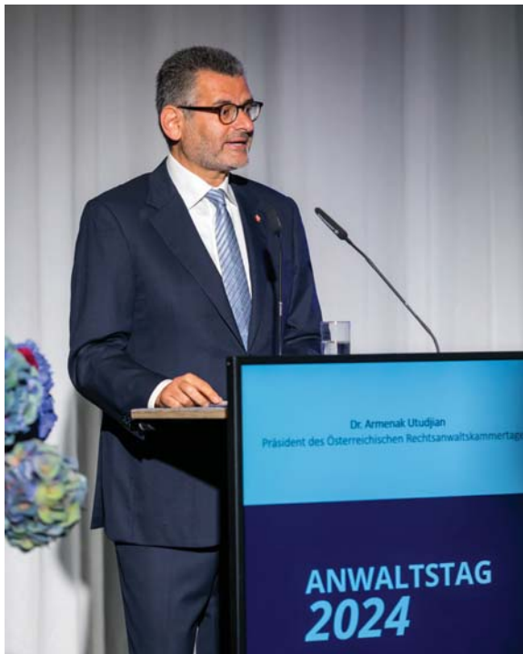
Eröffnung durch ÖRAK-Präsident Armenak Utudjian

Das Thema des Anwaltstags 2024 lautete „Gemeinsam für Gesellschaft und Rechtsstaat“. VfGH-Präsident Grabenwarter wies in seinen Begrüßungsworten auf die unverzichtbare Rolle der Rechtsanwaltschaft im Rechtsstaat Österreich hin.